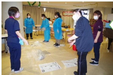
嘔吐物の 飛沫がど のくらい 飛ぶかの 実験

その後、立った状態の人の嘔吐物の飛沫がどのように飛ぶか、の実験をし、前方だけでなく後方にも飛ぶため、安易に近づくと介護者の足裏につき感染を拡げてしまうことを知りました。