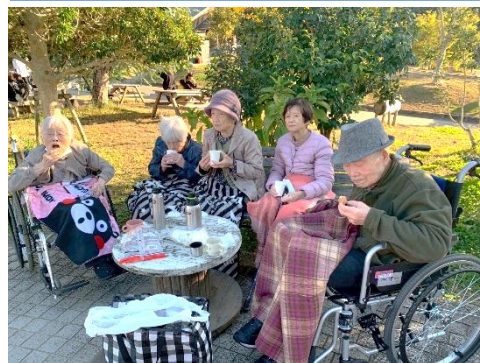
紅葉を見にドライブ