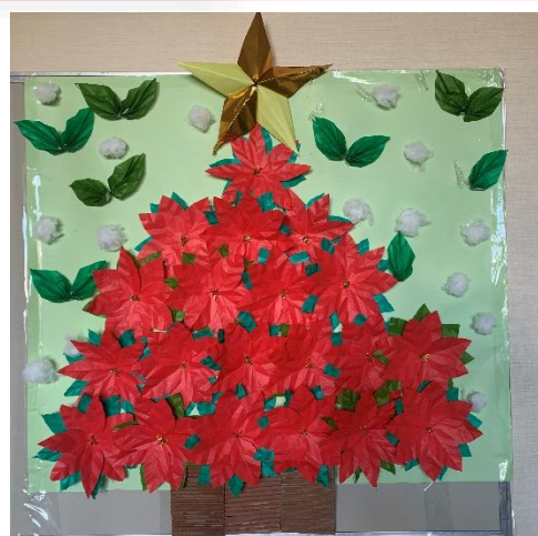
12月の壁紙 ポインセチア